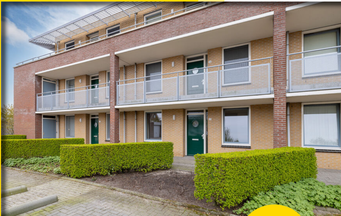
Herfsttuin 20, Barneveld