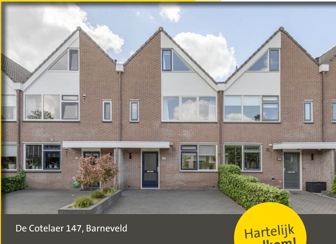
De Cotelaer 147, Barneveld